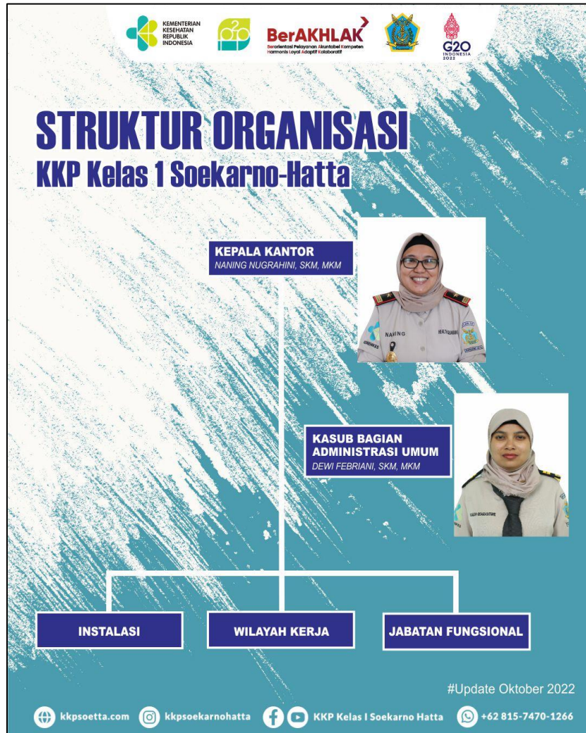
Gambar 1. Struktur Organisasi KKP Kelas I Soekarno-Hatta