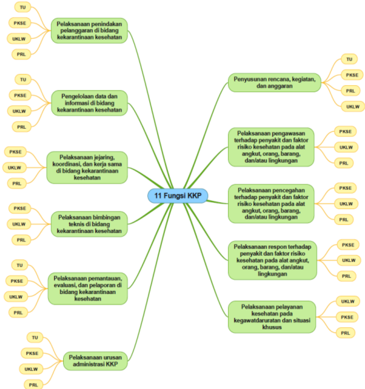
Gambar 2. Diagram Crosscutting Fungsi

Diagram crosscutting setiap substansi dalam melaksanakan fungsi sebagai berikut :